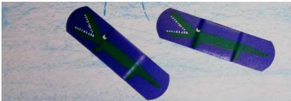
Los cocodrilos amigos