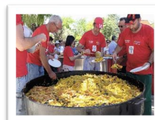
Villa San José