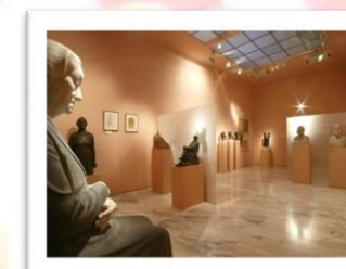
Museo Victorio Macho